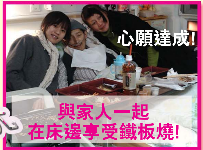
與家人一起 在床邊享受鐵板燒!