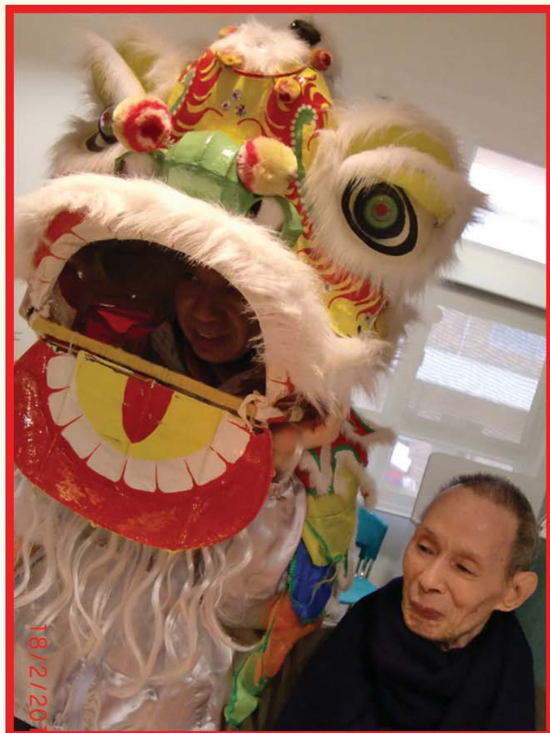
一起慶祝黃伯伯七十八歲生日!