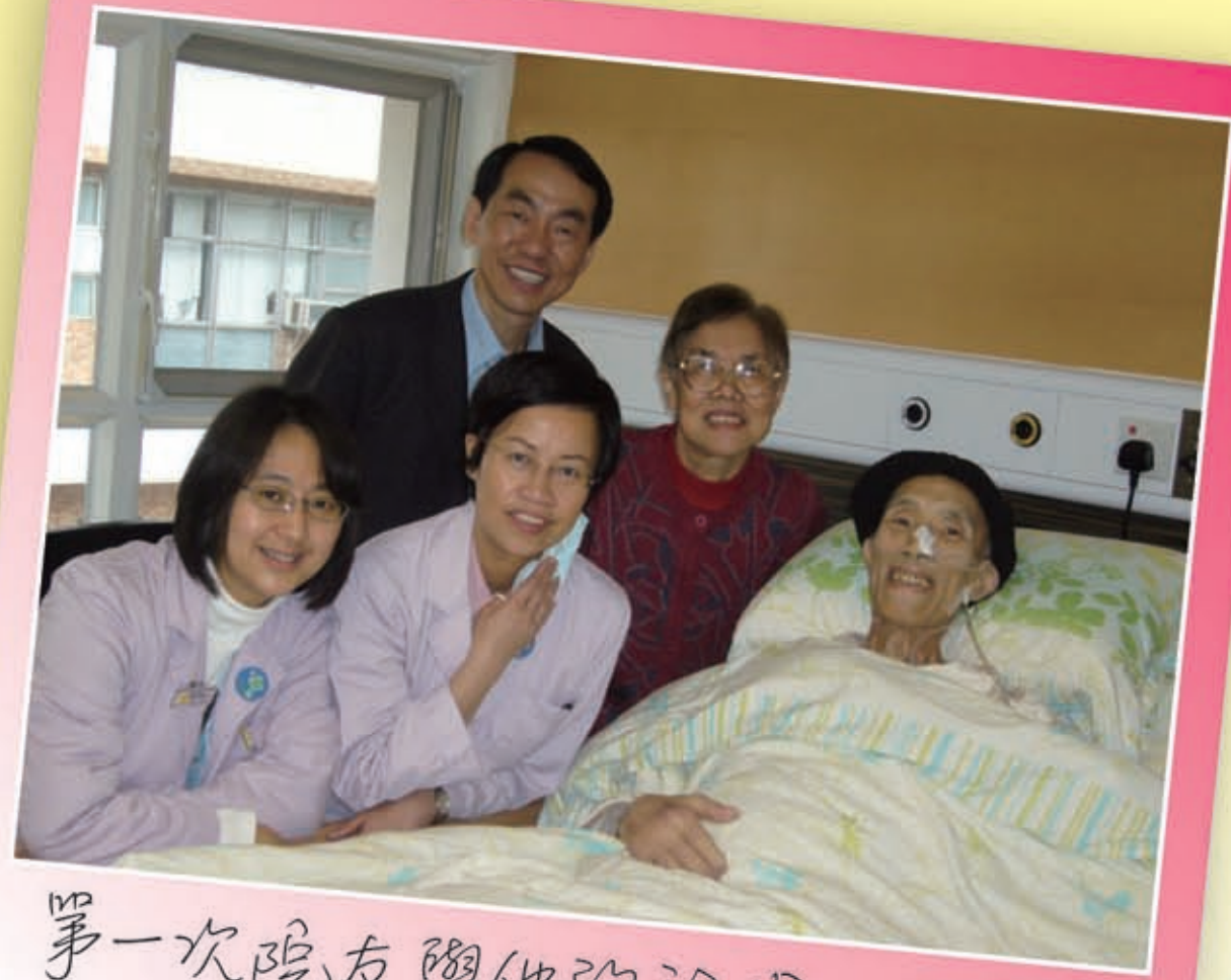
第一次院友與他的配偶一起受洗

有時仍會浮現許多已經離逝的病人，我想著他們，因為每一位都是獨特的。我很清楚，自己能堅持在臨終關懷路上是因著自己的委身。這是我一生中最有意義的工作，而這條路需要有心人繼續走下去。