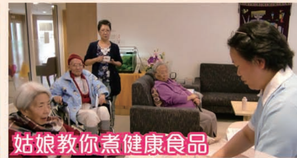
姑娘教你煮健康食品