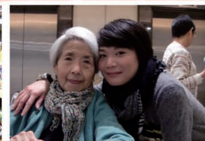
院友也有購買日用品的需要，我們會定時組織「購物團」，滿足大家的需要。