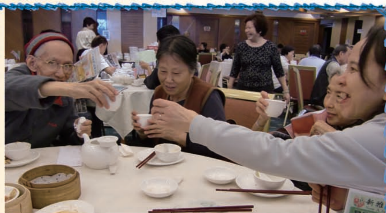
「飲啖茶，食個包」開開心心，食到飽