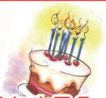
院友生日會 開開心心食壽包