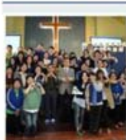
靈實司務道寧養院 @SASHCC