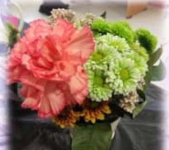
院友參與「園藝治療」的作品

走筆至此，適逢年卅晚，一年將盡，感慨萬千。人生沒有如果，只有結果，很多角色亦沒有重新來過。可惜，我們仍不斷在尋找自己的身分和角色， 如今 覺醒了吧，不要迷失方向了！憶苦思甜的愧疚：當年一片過年的氣氛，「唔好麻煩人」媽媽突然離世，對家人的打擊很大。愚往昔為父母所做的，實在太少了， 如今 只有緬懷。所以，珍惜眼前人，愛要及時！