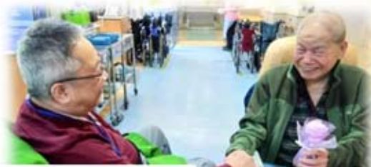
彼此分享，喜樂加倍

親手做些小禮物送給司務道樓的院友。看到伯伯笑著說：「謝謝啦！」動之以情，我回心微笑了，坐在輪椅上的感動呢！慶幸能成為第一批隊員，