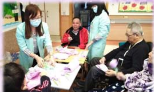
院友義工小組，自製小禮物送給院友

智能手機令溝通無障礙，太美好了。朋友 Y 太太 whatsapp 我「感恩妳的昔日」及 J 小姐「感恩妳的啟發，亦是推動我們往前的動力。不留遺憾，勇敢面對。」看完了，淚崩。 如今 自得其樂，看 Facebook 學習網購羽絨被、無花果、Godiva 朱古力等派街坊。渴望追求心靈的自由，必須學習放下無奈、不甘心、批評以及負面思緒等。 如今 病榻床上，自由何其重要？曾經有人問過：「怕別人看見妳坐在輪椅上的樣子？」哈哈！多麼自由啊， 如今 穿著睡衣素顏去見醫生做檢查，無想過我可以這麼不修邊幅外出哩。曾經有醫護人員輕聲說我的生命大概只有半年， 如今 奇蹟發生了，我輾轉來到靠近山邊的「華永樓」，環境清靜，床位靠窗，太陽射到掌心，好像重生了，生命賺多了。自幼在我的嚴苛下，已經成才成家的姨甥仔，從加拿大落機後立刻趕來，深切體會到親情的珍貴喔， 如今 真的無憾了，「媽媽最愛錫的人」我能夠等到他回來。況且，這裡有專業的醫護團隊給我紓緩治療，以及員工們都很友善。感恩他們無私的付出。年初，李社工成立了「院友義工小組」，互相關懷送暖，